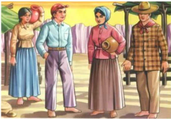
SERIS Y MAYOS

Los Seris y Mayos son dos grupos étnicos de México con raíces profundas en la región noroeste del país. Los Seris, también conocidos como Comcáac, han habitado las áridas tierras de Sonora desde tiempos ancestrales. Su conexión con la naturaleza se refleja en su arte textil y sus mitos sagrados que honran al mar y a la tierra.