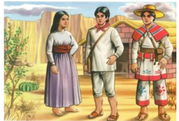
CORAS Y HUICHOLAS

Los Coras y Huicholes son dos grupos étnicos de México con una rica historia y tradiciones únicas. Los Coras, también conocidos como Nayaritas, habitan principalmente en el estado de Nayarit, mientras que los Huicholes se encuentran en la región de la Sierra Madre Occidental.