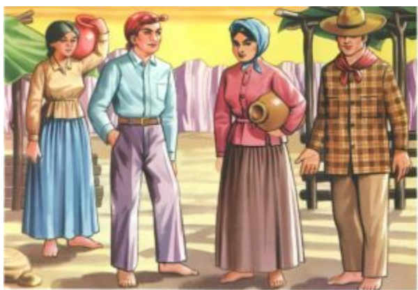
SERIS Y MAYOS

Los Seris y Mayos son dos grupos étnicos de México con raíces profundas en la región noroeste del país. Los Seris, también conocidos como Comcáac, han habitado las áridas tierras de Sonora desde tiempos ancestrales. Su conexión con la naturaleza se refleja en su arte textil y sus mitos sagrados que honran al mar y a la tierra.