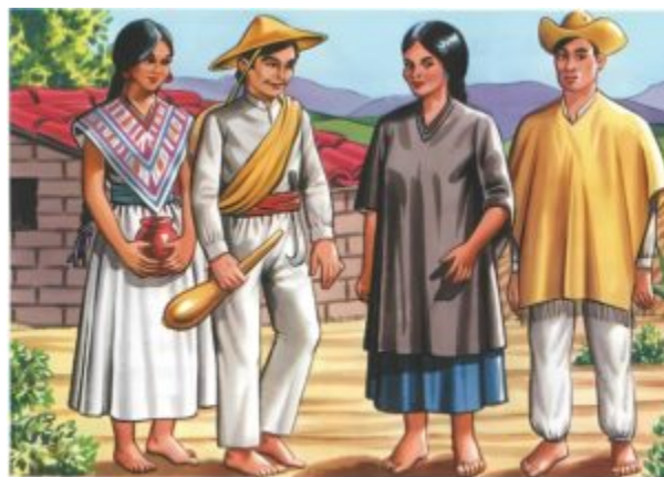
OTOMÍES Y NÁHUAS

Los Otomies y Nahuas son dos de los grupos étnicos más vibrantes y fascinantes de México. Los Otomies, también conocidos como Hñähñús, se destacan por su rica historia y arraigadas tradiciones. Su artesanía colorida y sus danzas tradicionales reflejan la profunda conexión con la naturaleza que caracteriza a este pueblo.