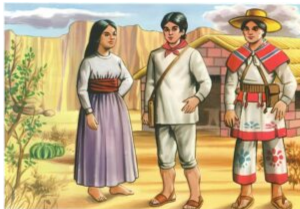
CORAS Y HUICHOLAS

Los Coras y Huicholes son dos grupos étnicos de México con una rica historia y tradiciones únicas. Los Coras, también conocidos como Nayaritas, habitan principalmente en el estado de Nayarit, mientras que los Huicholes se encuentran en la región de la Sierra Madre Occidental.