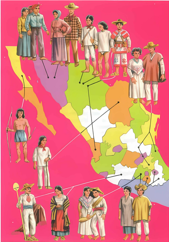
LA POBLACIÓN INDÍGENA DE MÉXICO